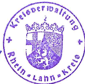
(Rainer Korn) Oberamtsrat