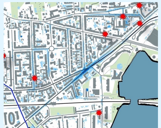
Auszug aus der Starkregengefahrenkarte von

Bei einem tatsächlichen Ereignis können die überfluteten Gebiete allerdings von den Informationen in den Karten abweichen. Denn in Starkregengefahrenkarten werden nur einige wenige mögliche Ereignisstärken und Bedingungen erfasst. Dennoch sind sie eine wichtige Planungsgrundlage für Hausbesitzer und Städte.