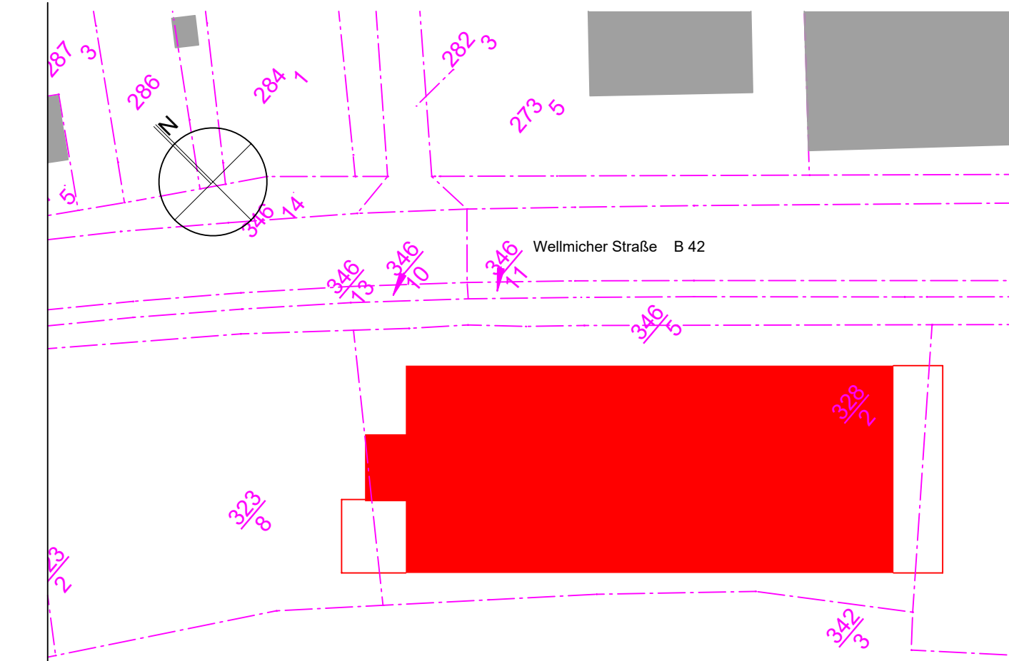
Lageplan M 1:500

± 0.00 = 73.775 müNN Alle Höhenangaben beziehen sich auf OKFFB.